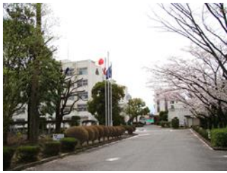
埼玉県立妻沼高等学校長